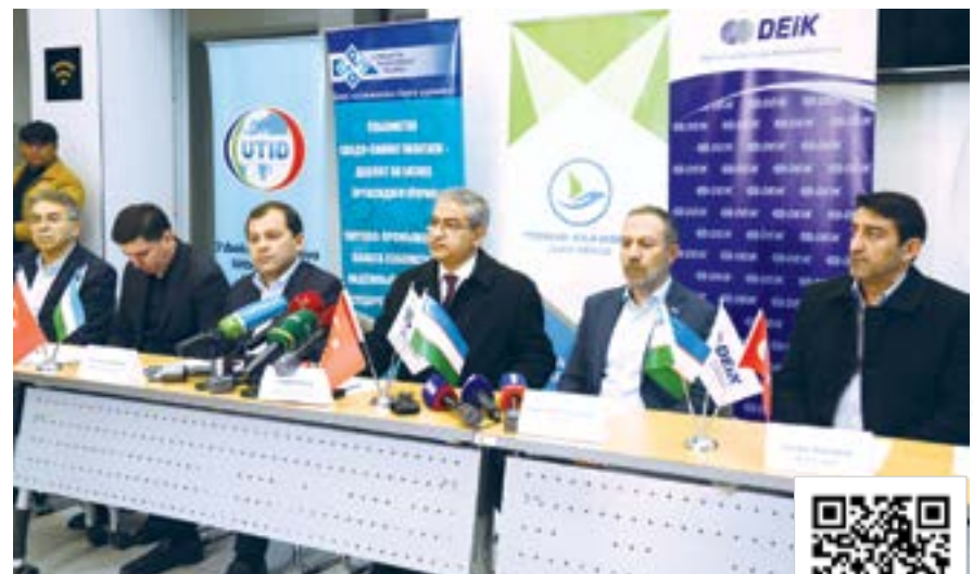
МАЗКУР QR-КОДИН СКАНЕР ҚИЛИШ ОРҚАЛИ ВИДЕОЛАВҲАГА УТИНГ.

Туркия Республикасининг мамлакатимиздаги элчихонаси билан ҳамкорликда Савдо-саноат палатаси, Ўзбекистон — Туркия тadbиркорлар уюшмаси, Ёшлар ишлари агентлиги ва бошқа ташкилотлар кўмагида табиий офат жабрдийдаларига