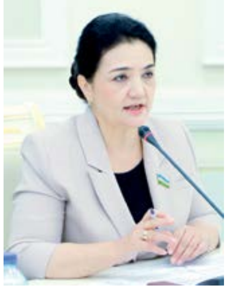
Мавлуда ХЎЖАЕВА, Олий Мажлис Қонунчилик палатаси Меҳнат ва ижтимоий масалалар қўмитаси раиси